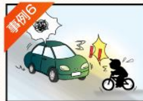
事例6 自転車での事故