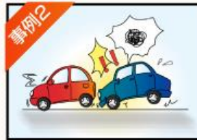
事例2 追突事故を 起こしてしまった