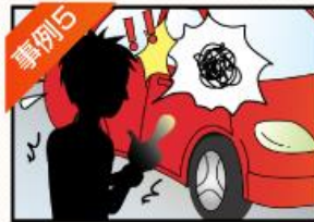
事例5 車のドアに指を 挟んでしまった