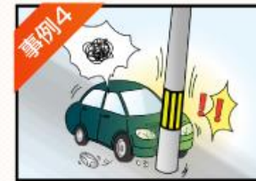
事例4 自爆事故を 起こしてしまった ※ガードレール、バック時、電柱