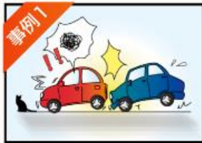
事例1 追突事故に 遭ってしまった