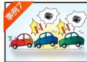
事例7 玉突き事故に 遭ってしまった