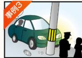
事例3 友人が運転する車に同乗して 事故に遭ってしまった